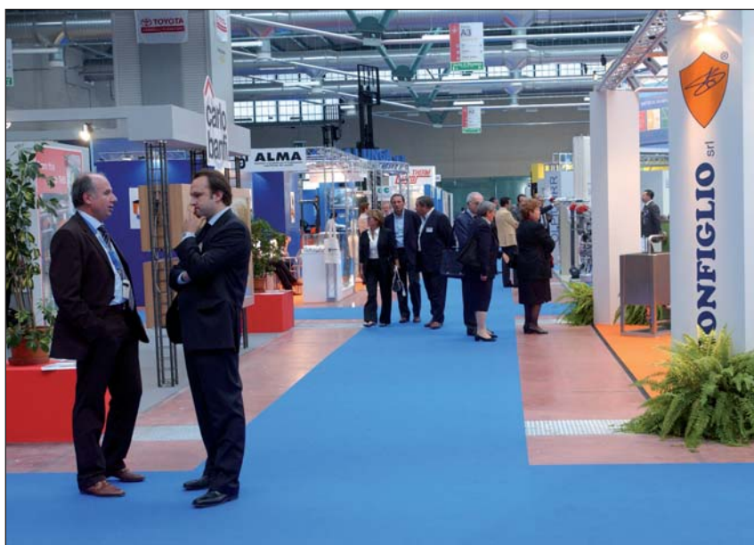
La prima edizione di "Finitura & Oltre" si è svolta a Bergamo nel settembre 2005